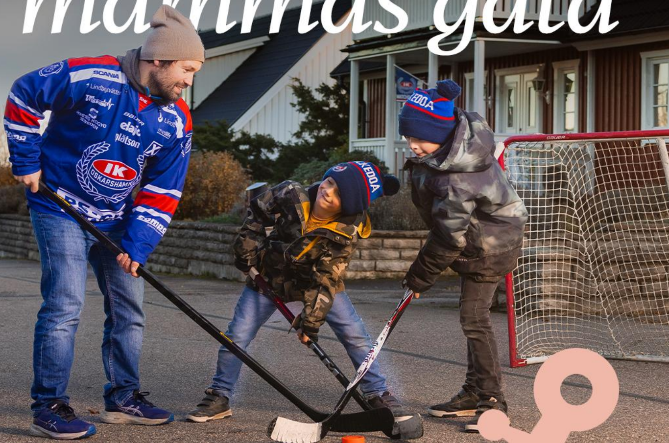
Bild från digital hemvändarkampanj julen 2025